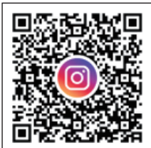
かすや町を盛り上げる会 Instagram

A 町民×議員、皆さんが 「粕屋町の未来」という 素敵なテーマで語り合う様子 に、ココを通過点にしてみん なで一緒に明るい未来へ進み たいとの想いを強くしました。