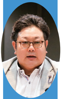
末若 憲治 議員