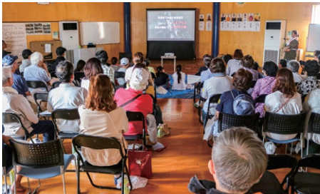
駕輿丁区防災訓練

町長 全く同感。災害は必ずやってくる。大事なのは「防災減災対策」である。災害が起こった後の対応は地域ではできない。人命の災害をどれだけ少なくするかはまさに人間が考えるべきこと。人と人との関係性において、それぞれの役割、防災組織の中での役割を考えながら災害に対することを町としても真剣に取り組んでいく。