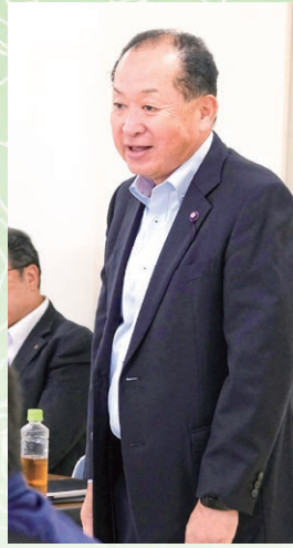
小池議長のあいさつ