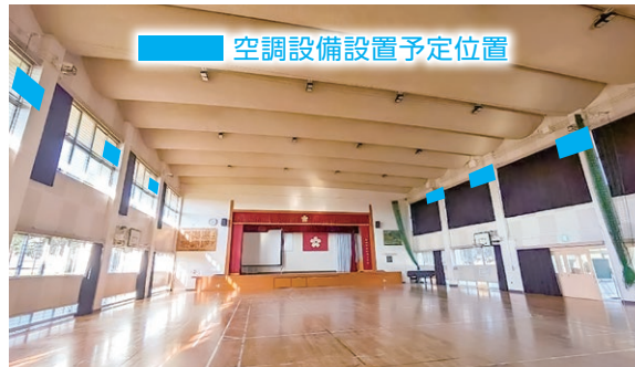
現況写真(仲原小学校)