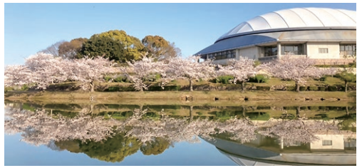
町民憩いの場駕与丁池