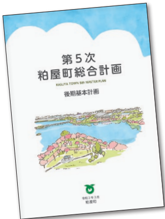
第5次粕屋町総合計画後期基本計画

える。事務を処理するに当たり、最小の経費で最大の効果を上げるようにするための指針となるものが総合計画であり、必要だ。また、総合計画は、町の将来像を示すものであり、これまでも策定のプロセスにアンケート、ワークショップやシンポジウムを実施し、町民参加の機会を設けてきた。第6次総合計画策定においても同様に機会を設け、職員だけで作る計画ではなく、町民と共に策定していくことが総合計画の意義だ。位置付けとしても、全ての行政分野における計画の指針となる最上位計画だ。