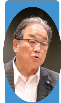
山脇 秀隆 議員

経営政策課長 物価高対策として、令和5年度は、住民税非課税世帯へ10万円給付、住民税均等割りのみ課税世帯へ10万円給付、低所得者世帯へ子ども一人当たり5万円