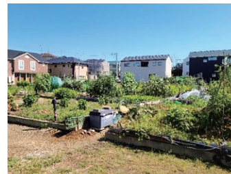
原町ふれあい農園