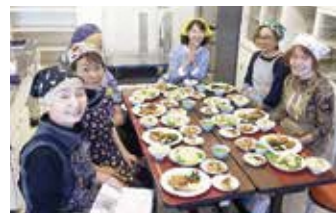
令和元年度にご参加の皆さん